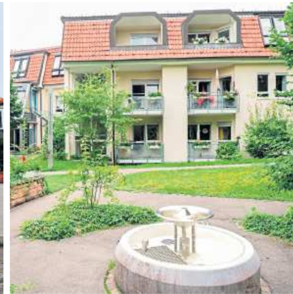
Die drei Häuser der Stiftung (von links): das Albert-Knapp-Heim in der Mühlstraße sowie das Gerokheim und das Geschwister-Cluss-Heim in der Mömpelgardstraße.