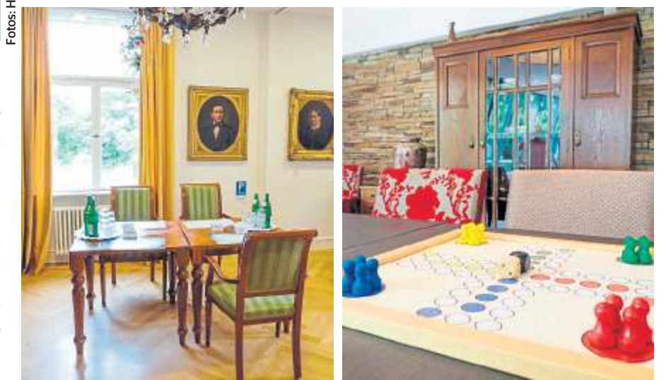
Ein Blick in die Gemeinschaftsräume des Gerokheims und die Gymnastikgruppe.