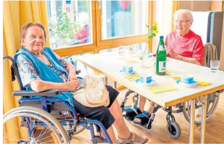
Ohne die Unterstützung der Ehrenamtlichen, sei es beim nachmittäglichen Heimcafé, beim Singen oder Malen, wäre vieles nicht möglich.

die jungen Menschen in Kontakt mit den Heimbewohnern zu bringen.