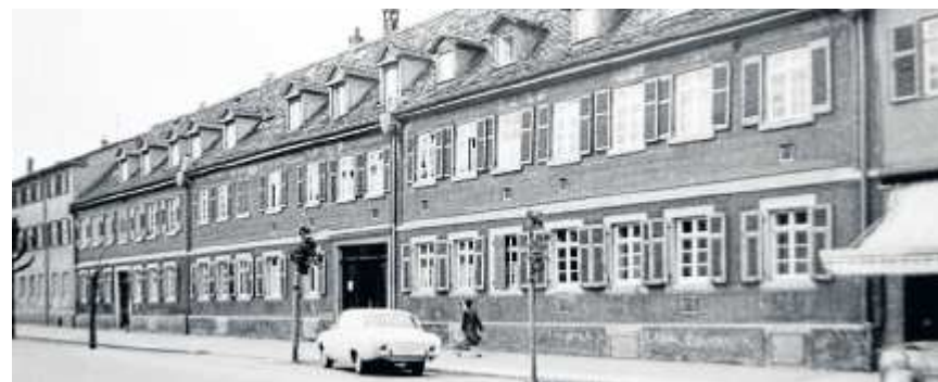
Blick auf das einstige Frauenheim in der Schorndorfer Straße Anfang der 1960er. Ein Jahr später, im Juli 1996, schwingen die Bewohner des Albert-Knapp-Heims

1868 kauft der Verein das Haus in der Schorndorfer Straße 53 und pflegt infolge des deutsch-französischen Krieges 50 verwundete Soldaten. Die zu bezahlenden Versiche-