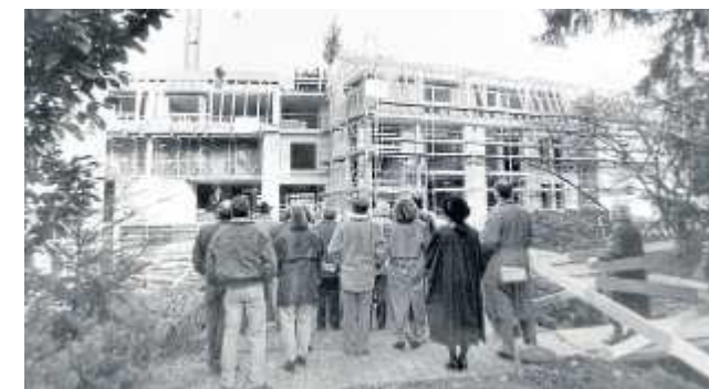
Jahre. (links) Im Februar 1995 wird neben dem Gerokheim das Richtfest für das Geschwister-Cluss-Heim gefeiert (Mitte). Beim Sommerfest das Tanzbein (rechts).